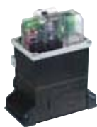
Motorsturing 780 D Technische specificaties zie p. 191