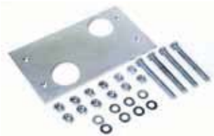
Funderingsplaat met zijdelingse en hoogteregeling