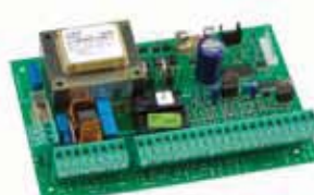
Motorsturing 462 DF Technische specificaties zie p. 188