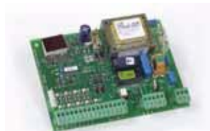
Motorsturing 578 D (installatie op afstand) Technische specificaties zie p. 191