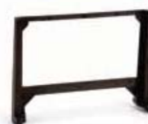
Kit voor inbouw stuurprint in 844