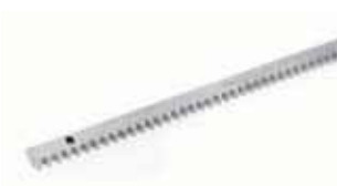
Pakket verzinkte tandlat M4, 30x12 (voor zware schuifpoorten), 4 secties van 1 m. met bevestigings-schroeven